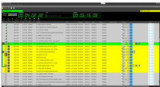
etere master control